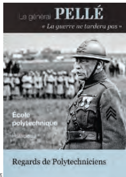
Couverture de la brochure de l'exposition consacrée au général Pellé (1882).

Rendez-vous sur le site http://www.sabix.org/